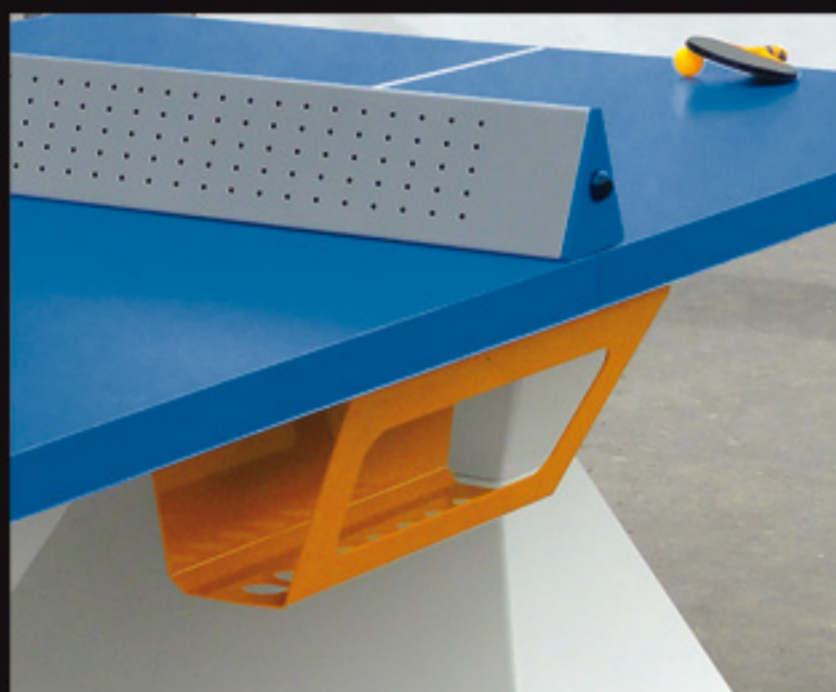
Table de ping-pong Diabolo

Diabolo est une table de ping-pong sobre conçue pour un environnement extérieur.